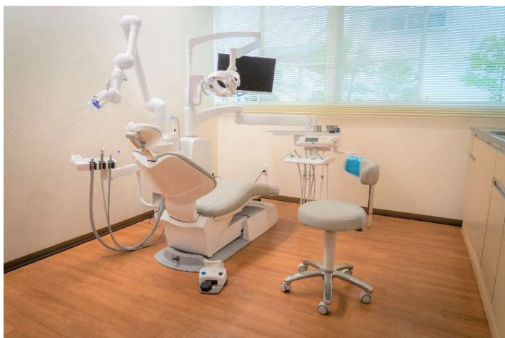
完全予約制でじっくり診察できる診療室

サンギデンタルクリニックは、歯科健診と治療に十分な診療時間を設け、唾液検査、細菌検査、う蝕・歯周病のリスクチェックで分析、受診者のメンテナンスファイルを作成して、より詳細な診断をします。